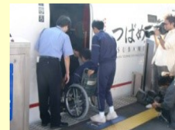
車椅子サポート体験