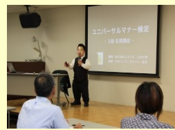
当事者講師によるセミナー