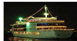
旅客不定期航路事業者 (遊覧船等)