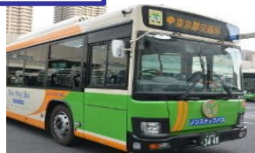
路線バス事業者(定期運行)