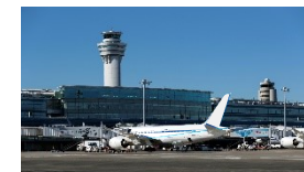
航空旅客ターミナル管理者