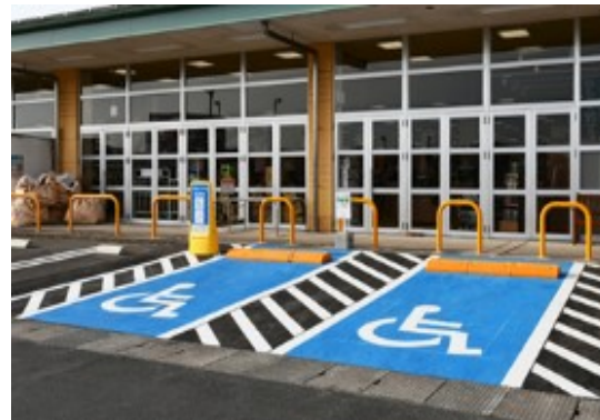
(車椅子使用者用駐車施設)