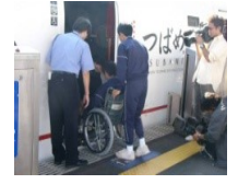
車椅子サポート体験