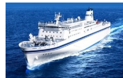
一般旅客定期航路事業者