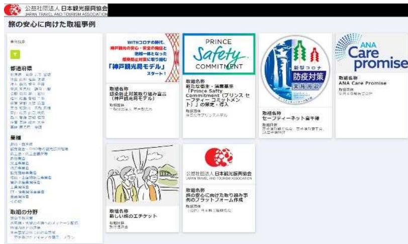
(取組一覧ページ・イメージ)

観光関連団体・企業の皆様におかれましては、旅行の安全・安心の確保に向けた取組へのご登録をお願いいたします（情報の登録は無料です）。ご登録に関するお手続きについては、別紙2をご参照下さい。