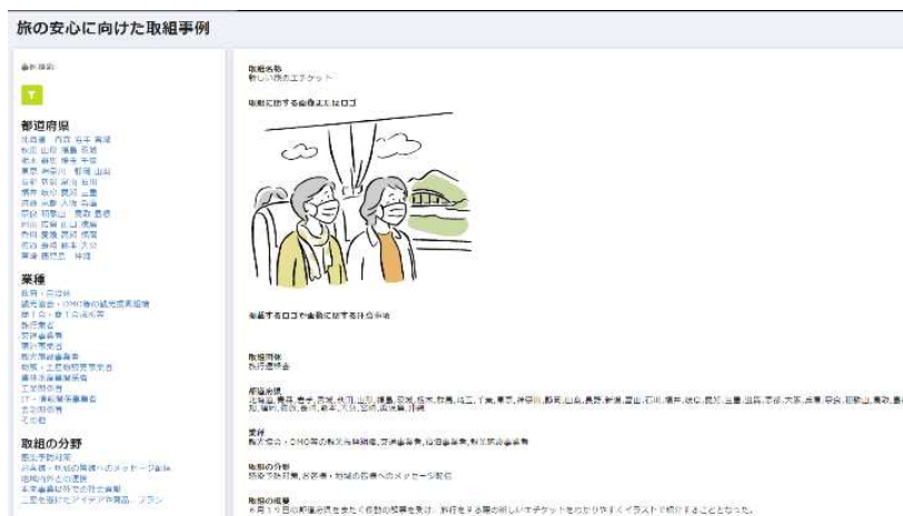
(個別事例ページ・イメージ)