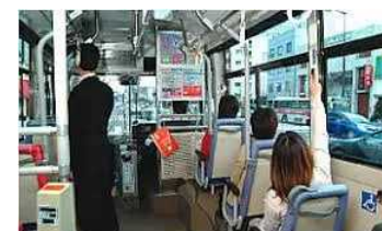
密度を保った実証運行