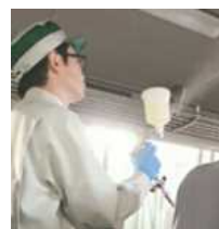
光触媒等車内抗菌施工