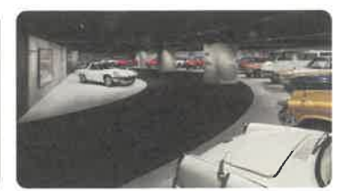
マツダミュージアム